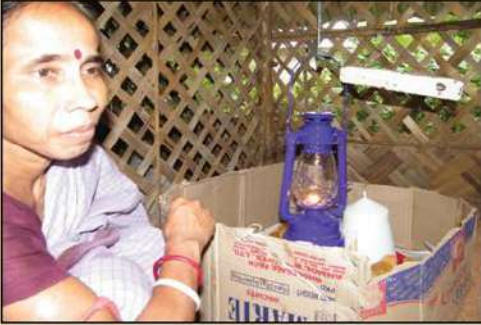
হ্যারিকেনের মাধ্যমে ব্রডিং