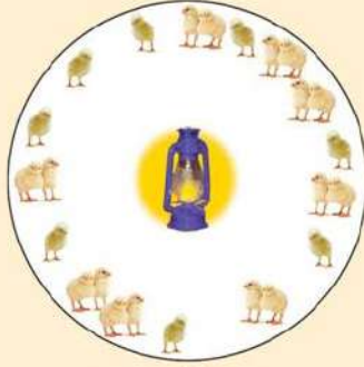
তাপ বেশী পেলো