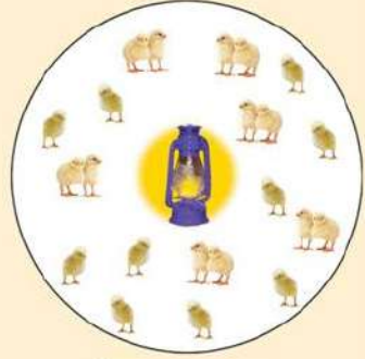
সঠিক তাপ পেলো