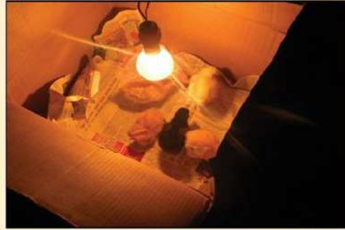
ইলেকট্রিক বাল্বের মাধ্যমে ব্রডিং

“ বাচ্চাকে অবশ্যই প্রথম একমাস চিক্‌ম্যাস খাওয়ান। ”