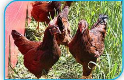
আর আই আর