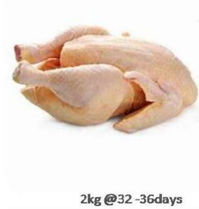
2kg @32 -36days